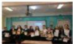
10-ая научно-практическая конференция учащихся «Через тернии к звездам!»