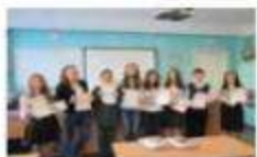
8-ая научно-практическая конференция учащихся «Через тернии к звездам!»

В школе подготовлена нормативная база, продумана организация работы по обхвату большего числа учителей и учащихся.