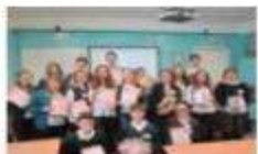
9-ая научно-практическая конференция учащихся «Через тернии к звездам!»